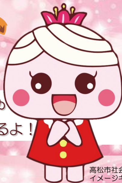
高松市社会福祉協議会 イメージキャラクター 「なごみちゃん」