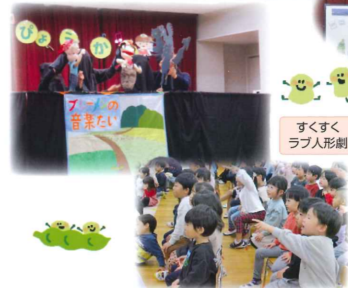
すくすくラブ人形劇