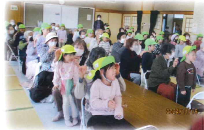
元気いきいきサロン