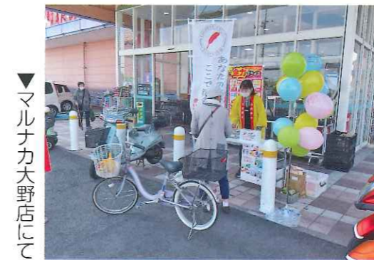
▼マルナカ大野店にて