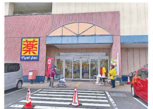
▼ウィングポートにて