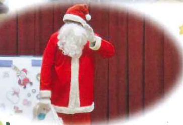
寿会交流(クリスマス会)