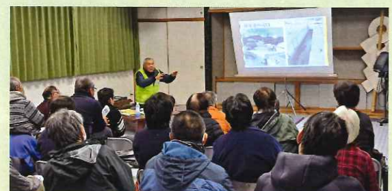
令和6年1月13日開催の高尻地区防災教室の様子

庵治地区社会福祉協議会では共助の基盤づくり事業の一環として、令和6年度も庵治地区自主防災連合会と連携して防災教室を自治会館等で開催します。