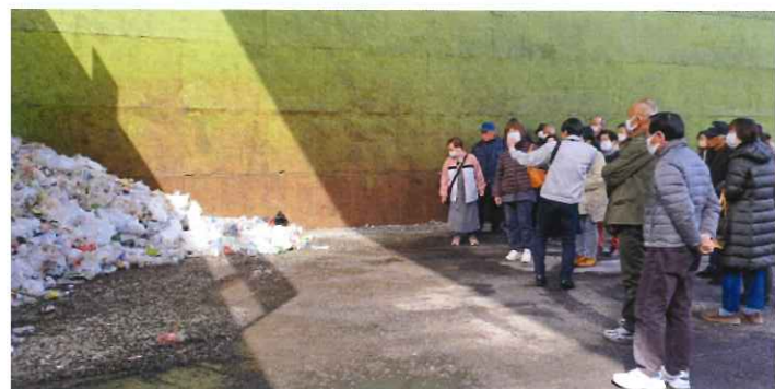
▲国分寺町 ビン・缶・ペットボトルのリサイクル工場 株式会社リソース