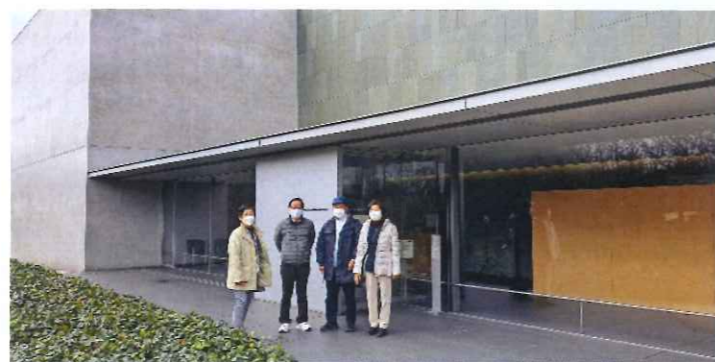
▲「東山魁夷せとうち美術館」