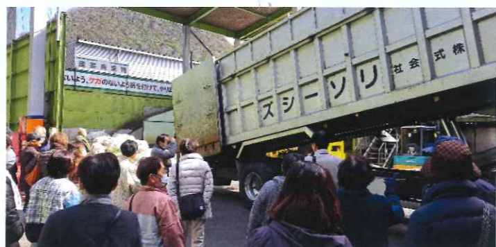
▲ビン・缶・ペットボトルが次から次と運び込まれます。