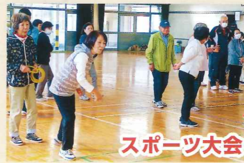
令和5年10月22日 山田ブロックスポーツ大会