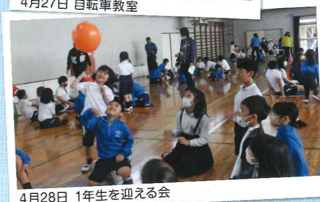
4月28日 1年生を迎える会