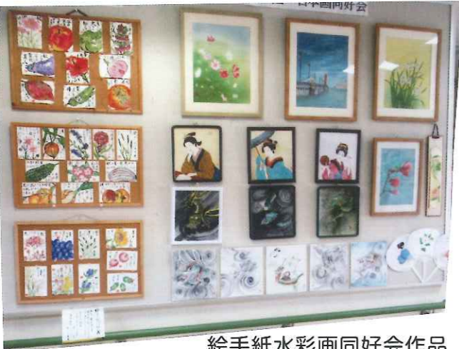
絵手紙水彩画同好会作品