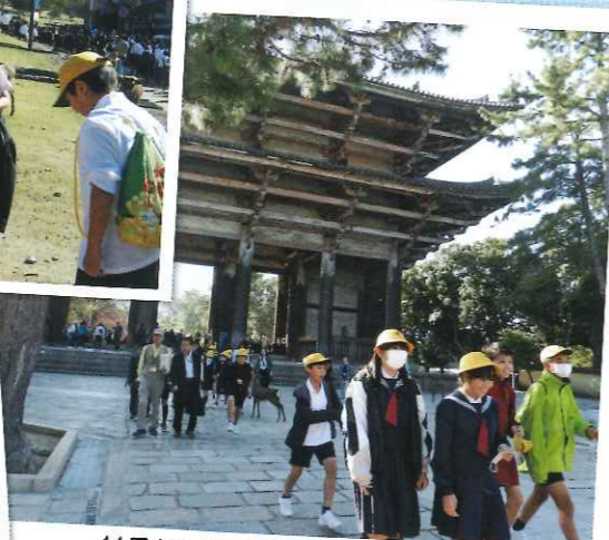
11月1日・2日 修学旅行(大阪・奈良・京都)