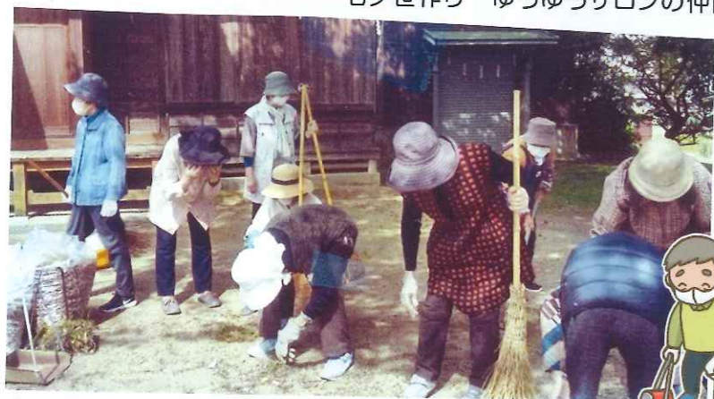
境内掃除も「福寿会」の行事です。