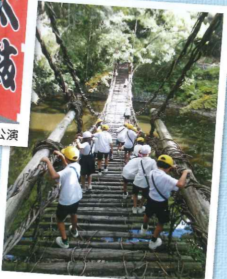
9月29日 秋の校外学習