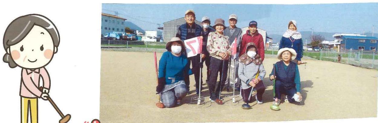
ペタンク・グランドゴルフの仲間です。