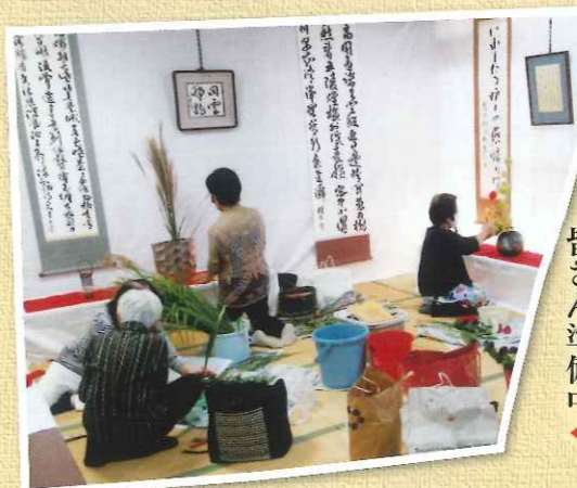
書道同好会の皆さん準備中▼