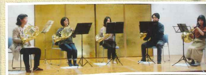
ホルンアンサンブルの演奏▲