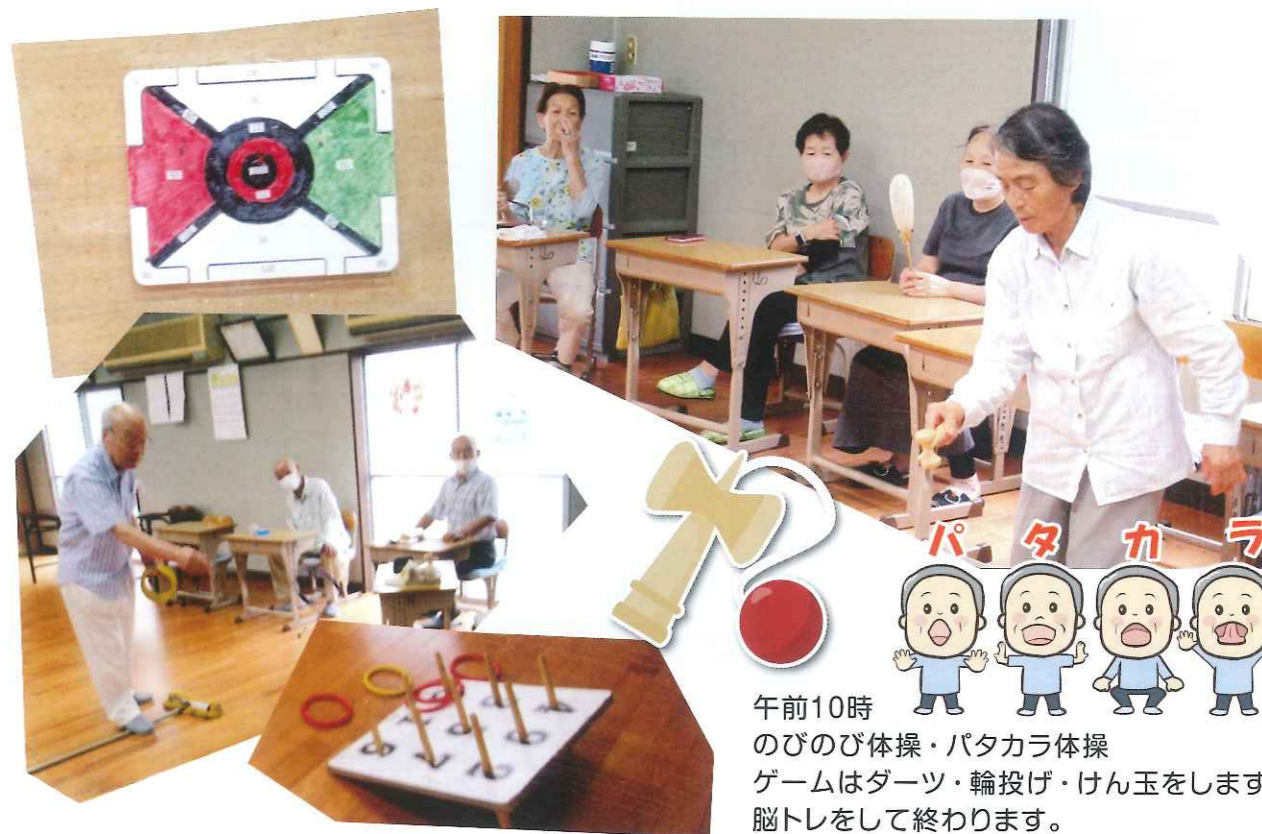
午前10時 のびのび体操・パタカラ体操 ゲームはダーツ・輪投げ・けん玉をします。 脳トレをして終わります。