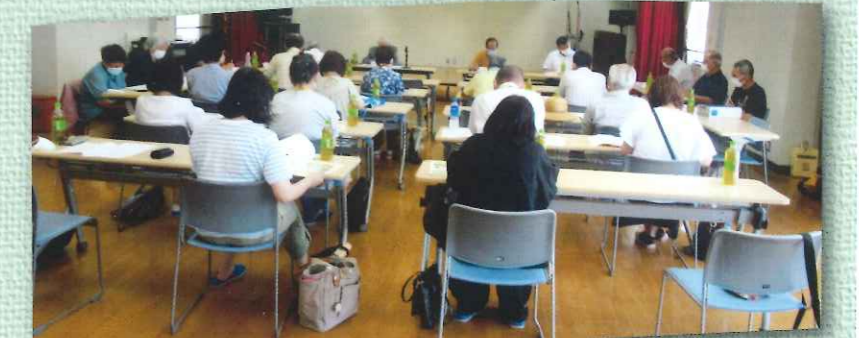
▲ 社会福祉協議会総会 R5年7月18日開催(過半数成立)