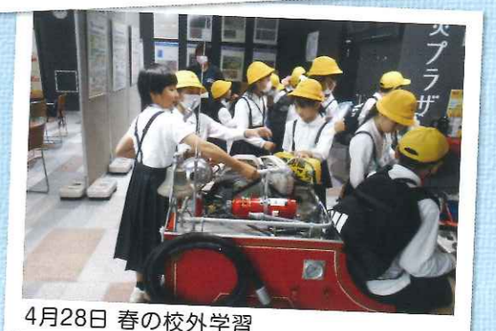
4月28日 春の校外学習