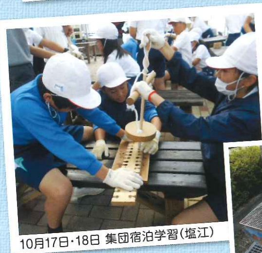
10月17日・18日 集団宿泊学習(塩江)