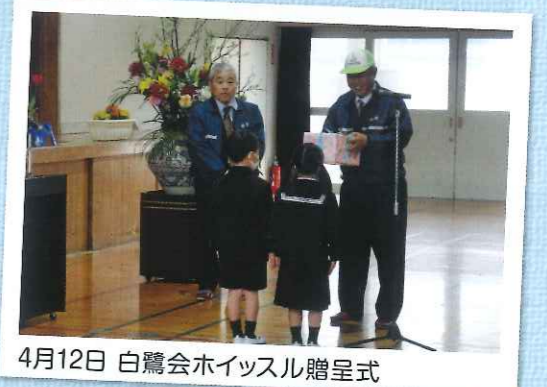
4月12日 白鷺会ホイッスル贈呈式