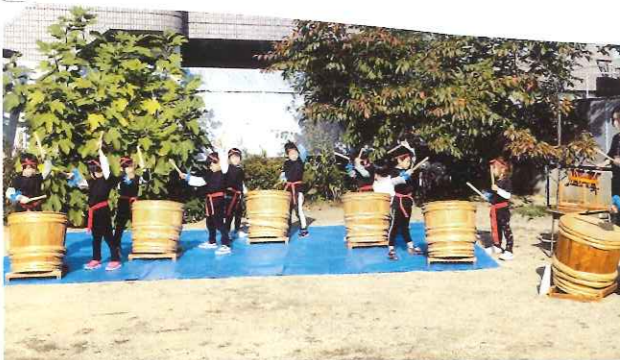
ハゼ歓寿会文化祭は鶴尾保育所の樽太鼓で始まります。