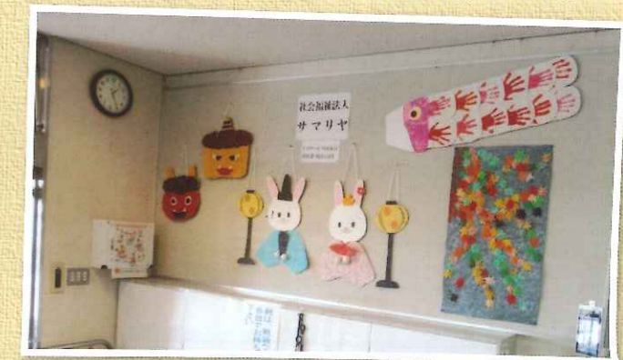
サマリヤの皆さんの作品▼