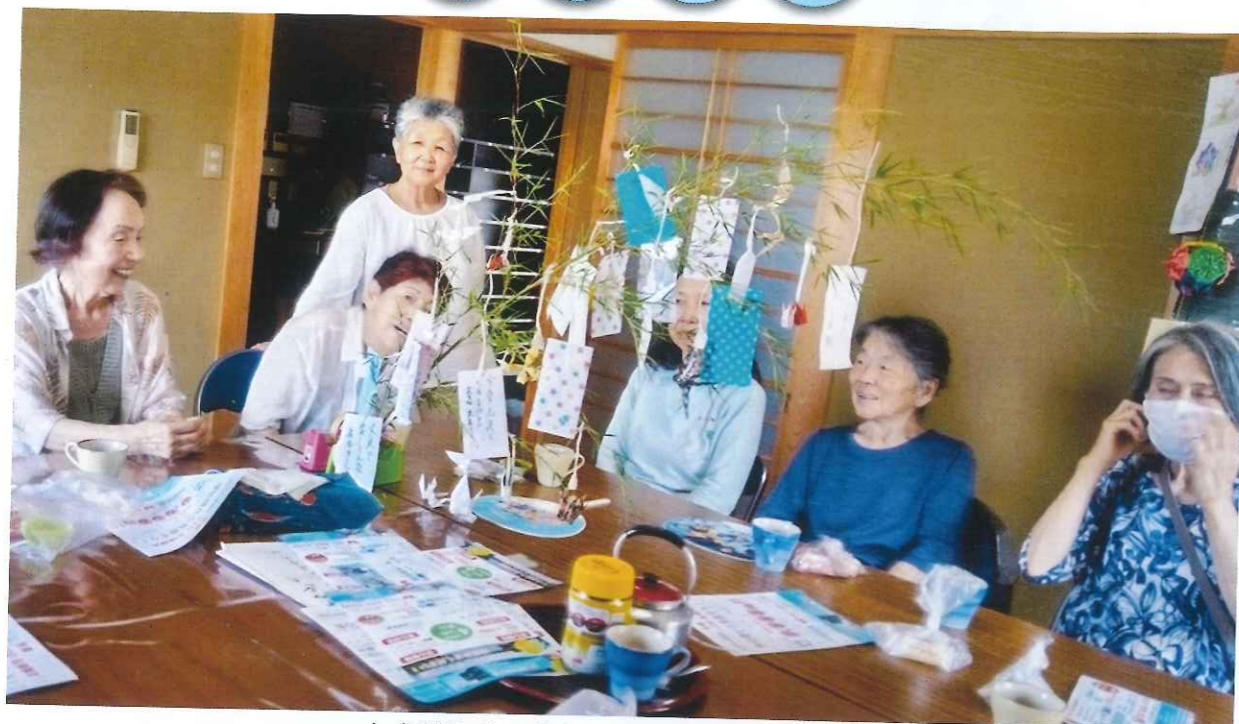
七夕笹作り ゆうゆうサロンの仲間です。