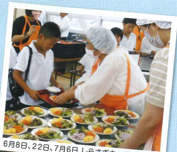
6月8日、22日、7月6日 しらさぎキッチン