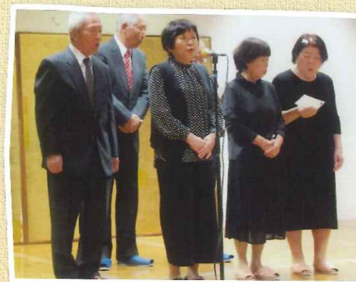
詩吟同好会の合吟▲