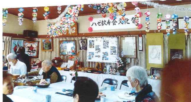
ハゼ歓寿会文化祭は11月の第2金・土曜に開催しています。