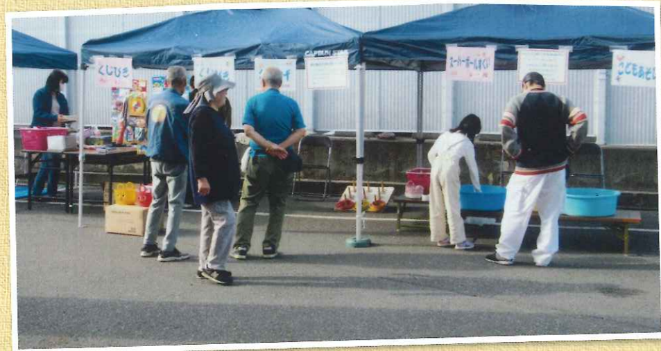
文化祭催し物準備中の皆さん