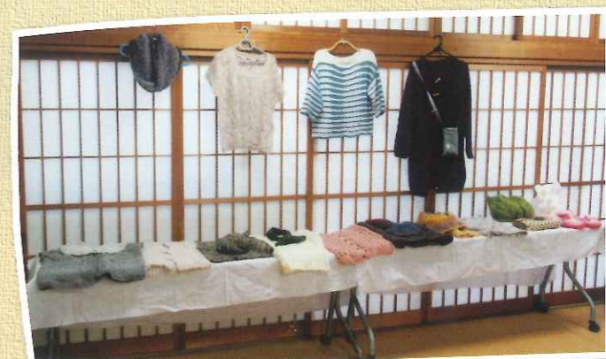
手編同好会の出品作品▲