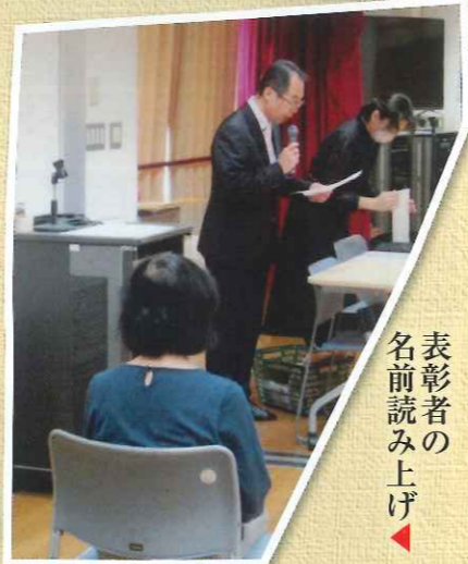
表彰者の 名前読み上げ