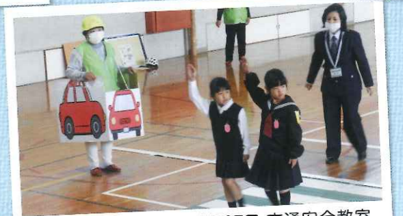
4月27日 交通安全教室