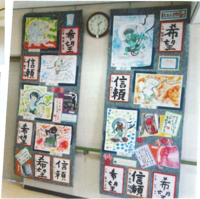
小学生の出品作品