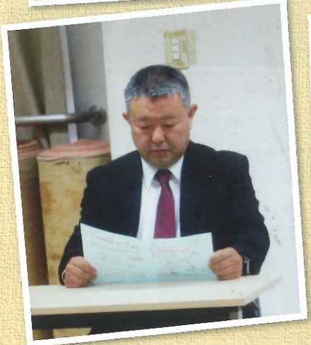
来賓出席の坂東秘書様