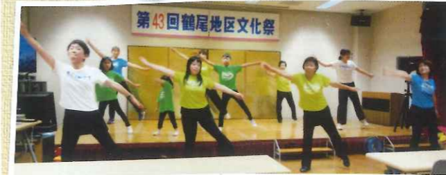
ステップ21グループの演技発表▲