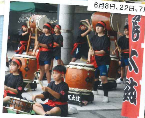
7月19日 鶴尾太鼓ゆめタウン公演