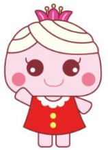
イメージキャラクター なごみちゃん