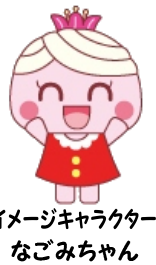
イメージキャラクター なごみちゃん

社協ワーカーだよりでは、市社協のコミュニティソーシャルワーカー(CSW)が、地域の皆様や関係機関の方々に向けて様々な情報を発信していきます！